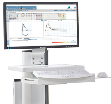
Software SentrySuite™ su Vyntus™ CART 3.b