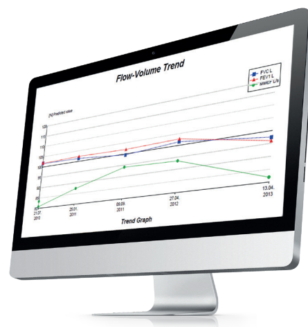
Monitor con risoluzione dello schermo raccomandata da 1920 x 1080