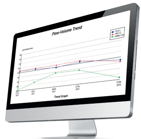
Monitor con resolución de pantalla recomendada 1920 x 1080