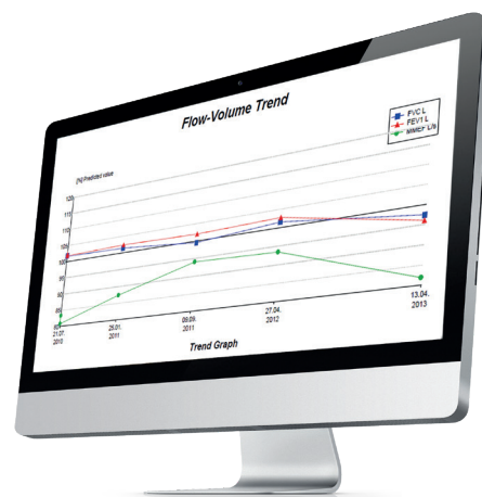
Moniteur avec une résolution d'écran recommandée de 1 920 x 1 080